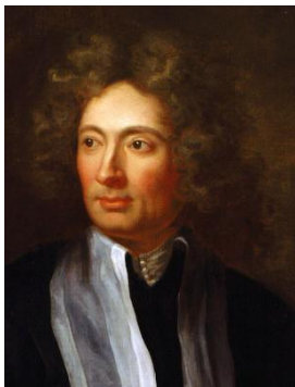
Arcangelo Corelli – (autor triových sonát),

Monódia – vedúca melódia s harmonickým sprievodom, polyfónia – inštrumentálny viachlas, orchestrálna hudba – concerto grosso , vokálno-orchestrálna hudba – kantáty, omše, oratóriá.