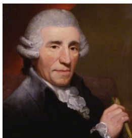
Joseph Haydn – viedenský klasik

tvoril symfónie – Ráno, Poludnie, Večer, 12 londýnskych, S úderom na tympany